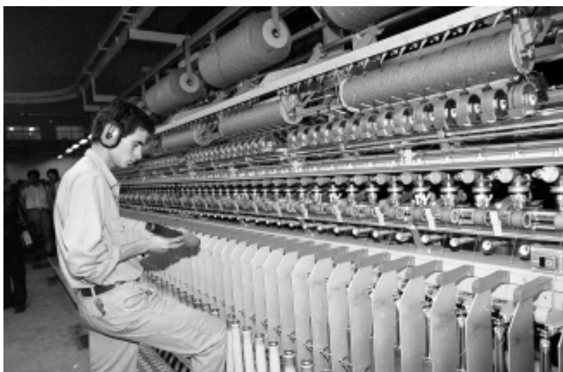
VESTIMENTA. El aumento exponencial de las importaciones retrajo el mercado doméstico para productos locales

El representante aseguró que tras la recesión que atravesaba el sector, la crisis internacional provocó una caída de 36% en la exportación de tejidos y de 35% en la de tops de lana, si se compara enero-mayo de 2009 contra igual período del año anterior. En tanto, se redujo 20% el personal ocupado. “Las condiciones de funcionamiento se deterioraron amplia-